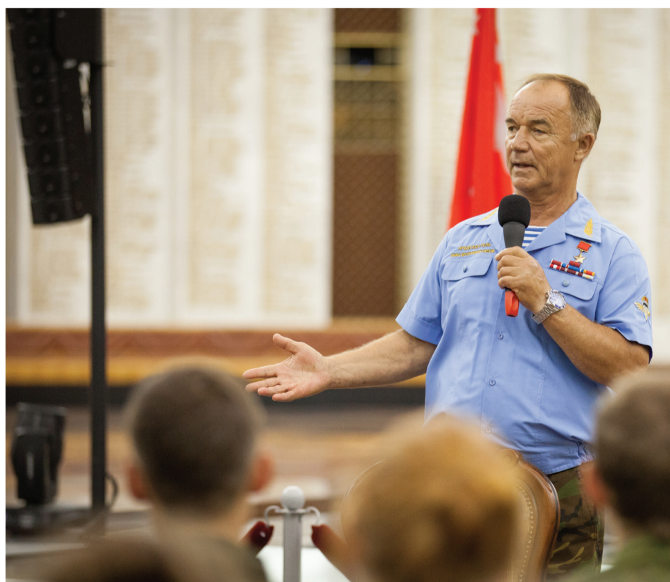
В. Востротин провел встречу в «Музее Победы» с учениками московских школ